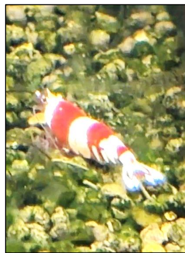
学校のレッドビーシュリンブ 本文との関連はありません。

やがて親の言うことにも、矛盾があったり、間違いがあったりすることに気づき始めた、子どもにとっての大きな成長なのです。親としては、口答えをされると、カッとなって怒鳴りつけたり突き放したりしたくなりますが、賢明な対応ではありません。そういうときには、頭ごなしに抑えつけるのではなく、「よく考えてみたら、あなたの言うことも一理あるね。お母さんもその点は気をつけるから、あなたもちゃんと決まりは守りなさいよ」と反応してみてもいいのではないでしょうか。子どもは自分の言い分も認められたので、注意もすっと受け入れられるようになるかもしれません。前述した「主体性」を大切にする姿勢に共通するものだと思います。