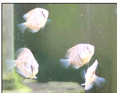
学校のディスカスの稚魚 本文との関連はありません。

この時期の子を持つ親に知っておいていただきたいことは、このような遊びが、子どもの自己肯定感を育てる意味で、とても重要であるということです。遊びというものは、楽しい体験です。それを通じて、この世は生きるに値する喜びがあることを知ります。また、遊びの中では、仲間が必要となります。そして遊びというルールのもとで、子どもたちは平等に扱われることを学びます。さらに、遊びには、大人が眉をひそめるようなものも含まれます。それによって、必ずしも大人にとって「いい子」でなくても、存在していることを学ぶのです。大人から見れば、単なる悪さやいたずらでも、子どもの成長にとっては大切な意味があるのです。「そういえば、自分も子どものころは同じようなことをしていた」と思えば、子どもたちを大目に見られるようになると思います。そのためには、安心して集団で遊べる場所や、子どもたちだけで歩いても安全な街を、私たち大人が意識して作っていく必要があると思います。