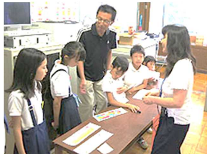
チケット販売<こじか学級>