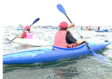
オーパル・カヌー体験<5年>