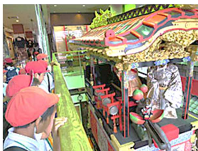
図書館・曳山展示館見学<3年>