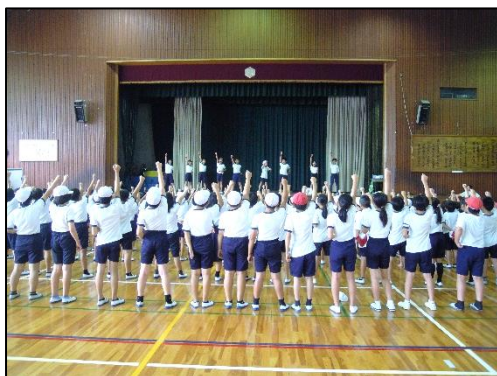
〈 応援練習風景 〉