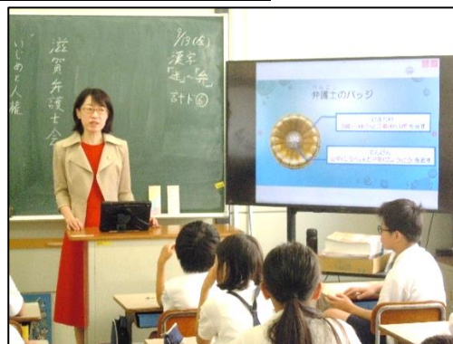
〈5年出前授業(弁護士)「いじめ問題や人権教育等に係る授業」〉