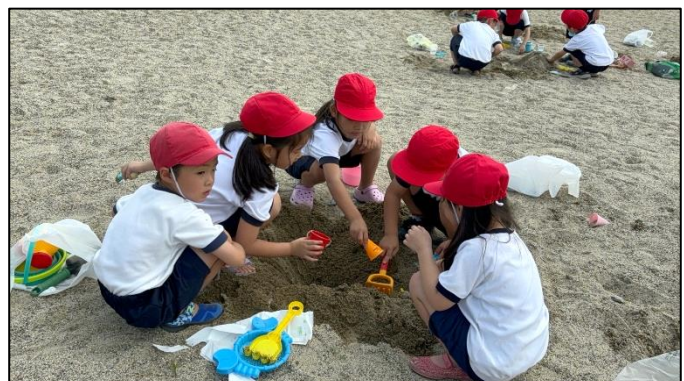
1年校外学習 サンシャインビーチ