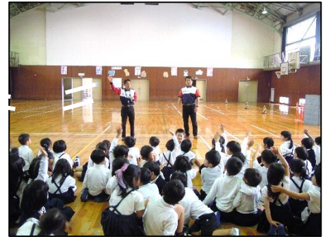
1・3年交通安全教室