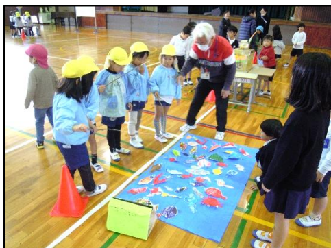
1 年生 秋まつり