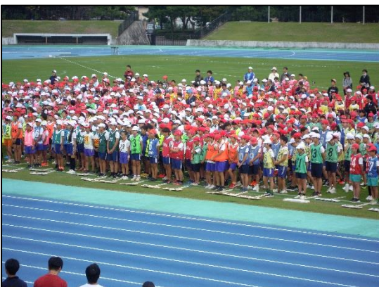
〈大津市陸上記録会〉