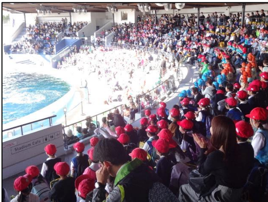
〈2年校外学習 京都水族館〉