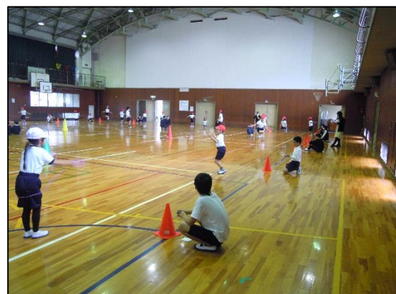
〈スーパートライ練習〉