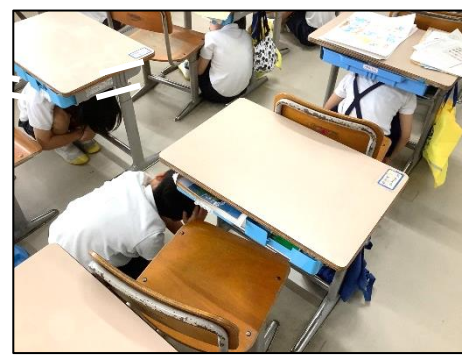
〈シェイクアウト訓練〉