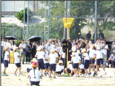
(1年 たまいれダンス)