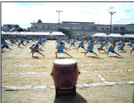
(4年 心をひとつにソーラン節)