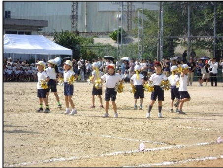
(2年 ぜぜっこスーパースターだゾ!)