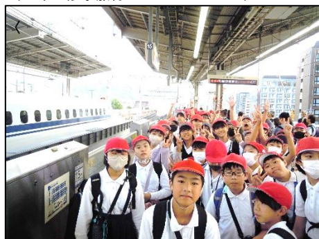
〈6年 修学旅行 24日～25日〉

10月に入り、運動会や校外学習が始まりました。今回は、運動会や10月31日までに実施された校外学習の様子を掲載します。