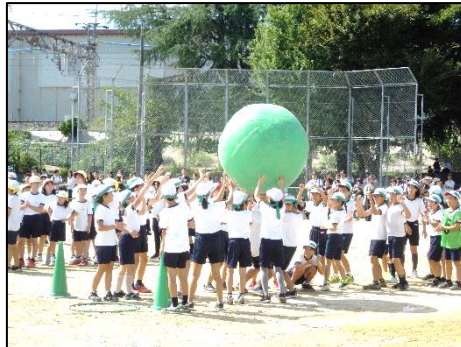
(5年 願いを込めた元氣玉)