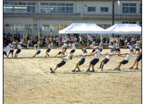
(3年 綱引きチャチャチャ)