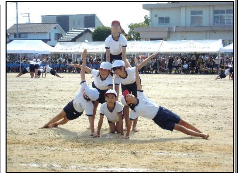
(6年 PRIDE~for you for me)