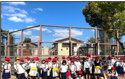
(1年 校外学習 動物園)