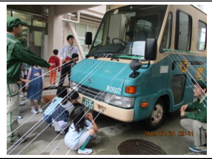
交通安全教室4月24日(水)

第1回の避難訓練を実施しました。今回の訓練の目標は、火災時の避難経路を確認すること・火災時に身を守る基本的なことを知り行動することでした。全校児童避難完了まで6分かかりました。目標より少し時間はかかりましたが、大変落ち着いて行動できていました。自分の命は自分で守らなければなりません。