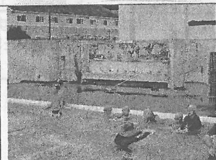
水泳教室(4, 5, 6年生)

7月21日から27日まで、9時15分から「かえるコース」、10時30分から「おたまコース」が実施されました。参加者は、のべ208名。「かえるコース」は、市の水泳記録会での活躍を、「おたまコース」は、25m完泳をめざし、どの子も自分の目標に向かってがんばり、泳力を伸ばしました。