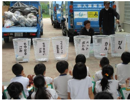
パッカー車見学（4年）5/9（火）～12（金）

低学年、中学年、高学年に分かれて、交通安全教室を開きました。低学年は横断歩道の渡り方、中・高学年はグラウンドに描いた道路や簡易信号機を使って自転車の乗り方などを学びました。地域のスクールガードの皆さんがたくさん駆けつけていただきました。皆さん、ぜひ、地域で安全を心がけましょう。