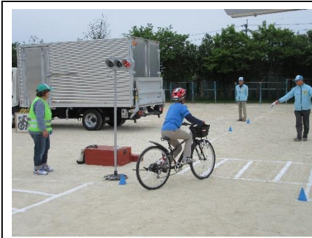
交通安全教室（全校）5/9（火）

低学年、中学年、高学年に分かれて、交通安全教室を開きました。低学年は横断歩道の渡り方、中・高学年はグラウンドに描いた道路や簡易信号機を使って自転車の乗り方などを学びました。地域のスクールガードの皆さんがたくさん駆けつけていただきました。皆さん、ぜひ、地域で安全を心がけましょう。