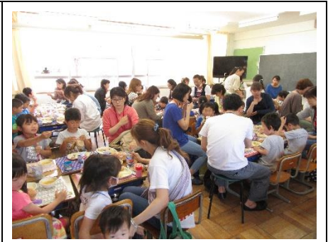
P T A ひびきあい（1年）5/29（月）

4年生は、「くらしとゴミ、上下水道」について学習しています。今年は、大津衛生社の方に来ていただき、実際にパッカー車「回転ダンプ式塵芥収集車」を見ながらゴミの収集や分別について、ていねいに教えていただきました。この日学んだことを19日のクリーンセンターの校外学習につなげました。