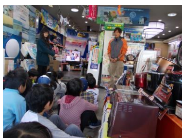
2年 名人さん学習（生活科）