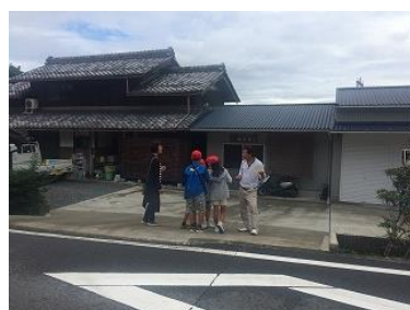
5年 安全マップづくり（総合的な学習）