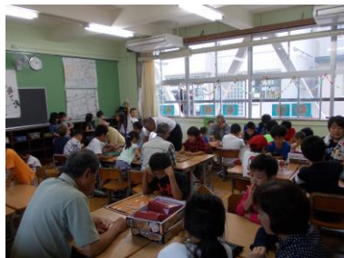
ふれあいルーム（全校）