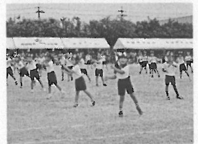
2年「ようこそ！おひさまのまちへ！」