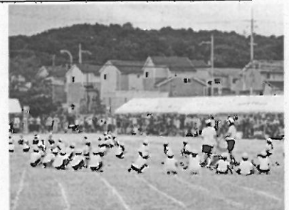
1年「まえむきスクリーム～玉入れ～」