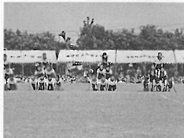
6年 団体演技「信じる」