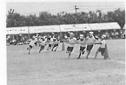
3年「走って・回って・とんで～台風の日～」