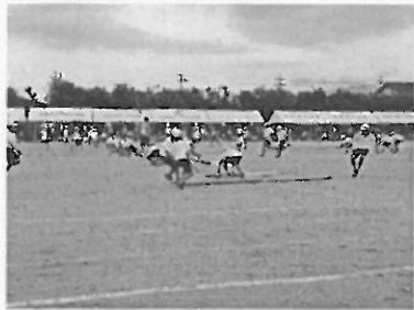
5年「とろんジャー～棒取り～」