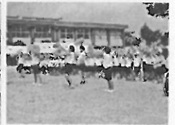
←応援団旗&応援合戦↑