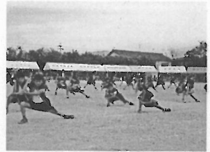
4年「光輝け！この星～ソーラン節～」