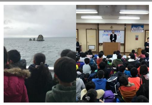
フローティングスクール(5年)

大人になってもめったに聴けない70人からなる大交響楽団の本格的な演奏を聴きました。いろいろな楽器を紹介いただき、その音色に合わせた曲も披露していただきました。また、児童代表による指揮に合わせて演奏していただく場面があり、難しいテンポの要求にも応えてくださいました。児童の合唱「ビリーブ」とのコラボの後、和邇小学校の校歌の生演奏のCDをいただきました。これを機会に音楽を愛し、演奏に興味をもつ子が出てきてくれればと思います。