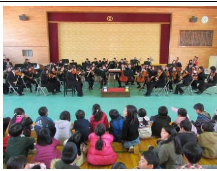
中部フィルハーモニー音楽鑑賞 12/11(月)

普段よくお買い物に行くお店ですが、売り場だけではなく、この日は店の裏側や総菜を作っているところ、冷蔵室や事務所なども見せていただきました。また、担当の方から環境のことも教えていただきました。例えば、近くでとれた野菜は速くのものより環境にいいことがいっぱいだと思います。他にも包装の少ないものを買ったり、エコバックやエコバスケットを使ったりすると環境を守ることになるということも学習しました。