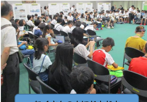
たくさんの人にドキドキ

9月14日(土)に、本校を代表して4名の児童(6年2名、5年2名)が大津っこ未来会議に出席してきました。大津市内の小学校全ての代表が集まり、学校でのいじめ防止に関する取組を発表する会議です。市長の話を聞いたり報道陣がいたり緊張した空気の中でしたが、そんな雰囲気にも少しずつ慣れ、和通小の代表として立派に発表しました。