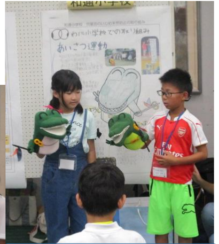
2回目は、少し慣れてきました

一大イベントである運動会が終わり、学校は平常を取り戻してきました。どの学年も、しっかりと黒板に向かい、授業を受ける様子が見られます。大根の間引きや水鉄砲の実験など様々な活動をのびのび学んでいる様子が印象的です。