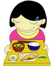
大津市食育推進キャラクター “おぜんちゃん”

今年度も残りわずかとなりました。3月 は学校生活の締めくくりの月ですね。 この 1 年間の振り返り、日頃の食生活を見直してみましょう。