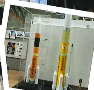
宇宙センター(イメージ)