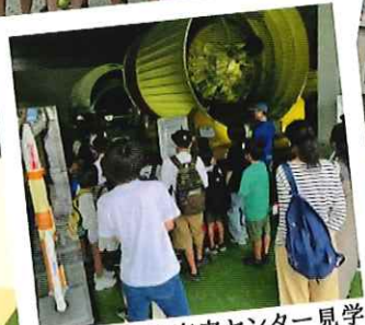
2023年度宇宙センター見学