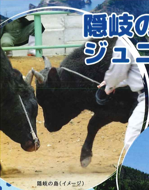
隠岐の島(イメージ)