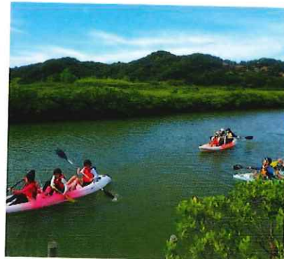
2023年度マングローブツアー