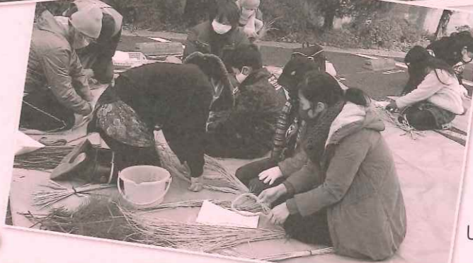
しめ縄作り(滋賀学区)