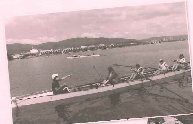
瀬田川でボートに乗ってみよう! (瀬田南学区)

大津市青少年育成市民会議だより 第28号 2021年10月1日発行 発行 大津市青少年育成市民会議 編集 広報委員会 事務局 大津市役所 文化・青少年課内 Tel. 528-2706