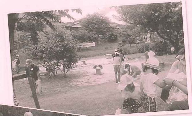
三田川水辺の親子清掃(晴嵐学区)