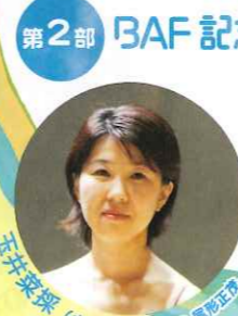
山井菜菜 (ヴォーカリスト)