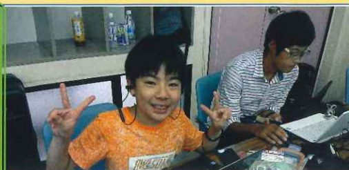
小・中学生が作った GPS 搭載の 環境測定ロボットロガー