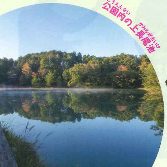
公園内の上風尾池 こうえん内のうかぜおおいし

瀬田の丘陵地にある公園は、珍しい草花や昆虫が見られます。 桜や紅葉も美しく、四季折々の景色が来園者を魅了します。 私たちが管理する公園は、大津市内の東南部81カ所。 誰もが安全で楽しい公園づくりに日々努めています。 体育館では、子ども体操、卓球、バスケットの教室もあります。