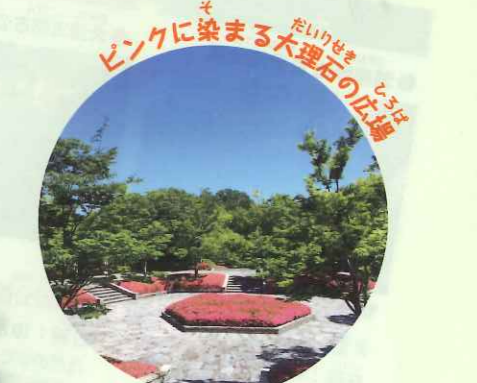
ピンクに染まる大理石の広場 ぴんくにそまるたいりせきひろば