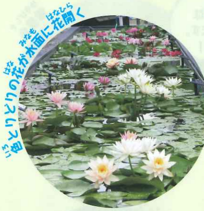
色とりどりの花が水面に花開く いろとりどりのはながうみねにはなひらく

草津市立水生植物公園みずの森 〒525-0001 滋賀県草津市下町1091番地 TEL: 077-568-2332 FAX: 077-568-0955 メール: info-mizu@seibu-la.co.jp 開園時間: 9:00 ~ 17:00 夏季期間 (7月中旬 ~ 8月中旬) 7:00 ~ 17:00 冬季期間 (11月 ~ 2月) 9:30 ~ 16:00 休園日: 毎週月曜日 (月曜日が休日の場合は次の平日が休園日)、年末年始 入園料: 大人 300円、高校・大学生 250円、中学生以下無料