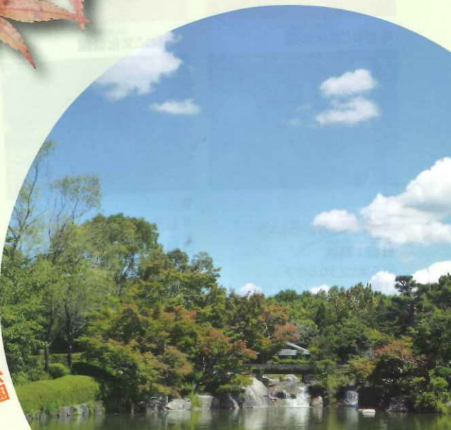
日本庭園のあまのこ にほんてい園のあまのこ

滋賀県営都市公園びわこ文化公園 〒520-2122 滋賀県大津市瀬田南大萱町1740-1 TEL: 077-543-5831 FAX: 077-547-4666 メール: info-biwakobunka@seibu-la.co.jp 開園時間: 年中無休 公園管理事務所 8:30 ~ 17:00 (年末年始除く) 茶室夕照庵 10:00 ~ 16:30 (冬季10:00 ~ 16:00) 休園日: 茶室夕照庵 毎週月曜日 (月曜日が休日の場合は翌日)、年末年始 入園料: 無料