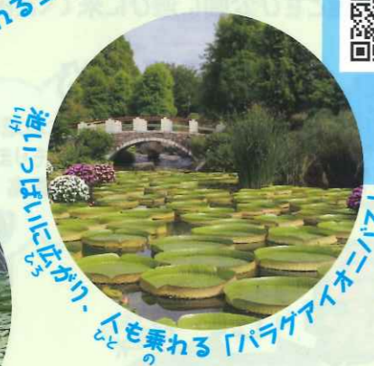
川に浮かぶ「パラグアイオニオン」 かわにうかぶ「パラグアイオニオン」

河川敷4haに 全天候性テニスコート20面と 多目的グラウンドがあり、 多くのスポーツ愛好者が 利用しています。