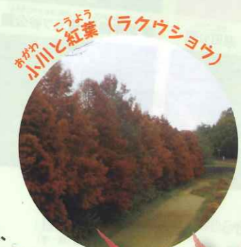
小川と紅葉 (ラクウショウ) こがわとこうよう

約43haにおよぶ園内は、「山エリア」「原っぱエリア」「文化施設エリア」があり、 豊かな自然に囲まれた都市公園です。 豊かな花と緑のあふれる公園で多彩な楽しみ方や 過ごし方を見つけていただけます。