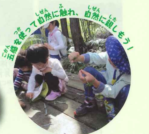
五感を働かせて自然に触れ、自然に親しもう! ごかんをたづねて自然に触れ、自然に親しもう!