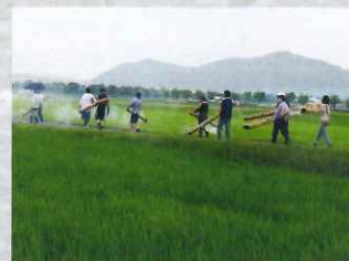
米に関する行事（虫送り）