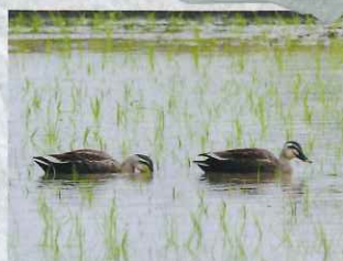
田んぼにやって来る生き物（カルガモ）