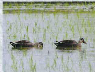
田んぼにやって来る生き物（カルガモ）