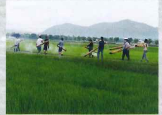
米に関する行事（虫送り）