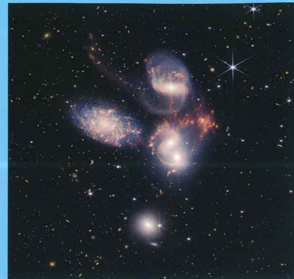
ペガスス座にある「ステファンの五つ子」(HCG 92)