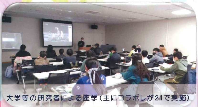
大学等の研究者による座学(主にコラボしが21で実施)

この問題は どうしたら かいけつできるかな？ 学んで 考えて 発見！ 自分の表現で 伝えよう！