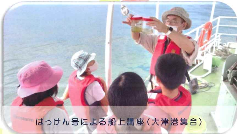
はっけん号による船上講座(大津港集合)