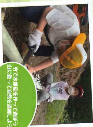
竹で水筒を作ったおもしろい！ 山に登って自然を満喫しよう！

☆レジャーシーズン期間が多い！ 一本でも多く滑ればそれだけ上達も早い！午前・午後それぞれ3時間の合計時間のレッスンを行います。また夜間は40分程度室内でレッスンをを行います。不安定な雪の上ではなくリフトアップした状態での振り回し、翌日のレッスン内容の確認を行うことでより上達を促します。 ☆基本を大切に！ 実は事故も多いスキー。「子どもが楽しそうだから」という理由で、安易にフリー滑走させるスノーレは絶対ダメ！のあつく自然学校ではきそからしっかりレッスンを行い、自分でコントロールできるスキーヤーを育てます。 ☆楽しく安全に 海外では当たり前のスキー時のヘルメット着用。子どもの安全のため、のあつく自然学校では2012年冬よりスキースクールでのヘルメット無料貸し出し（全員着用を義務化）。また移動時のバスも「安い」バス会社ではなく、「安全に走る」バス会社を選定しています。