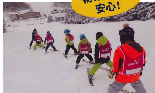
◎リトルキッズスキーキャンプ春の日程は、2023年3月26日(日)～29日(水)となります。