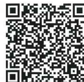
◎中高生スキーキャンプ春の日程は、2023年3月24日(金)～30日(木)となります。