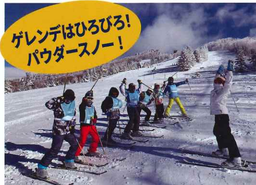
◎小学生スキーキャンプ春の日程は、2023年3月26日(日)～29日(水)となります。