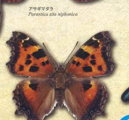
アサギマダラ Parantica sita nipponica