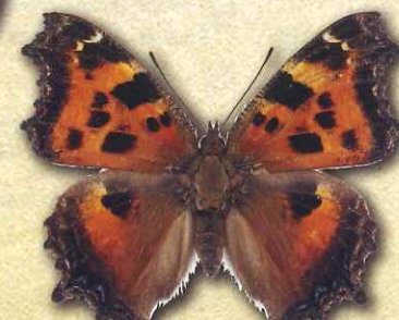
ヒオドシチョウ Nymphalis xanthomelas japonica