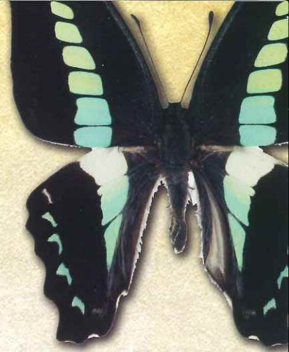
アオスジアゲハ Graphium sarpedon nipponum