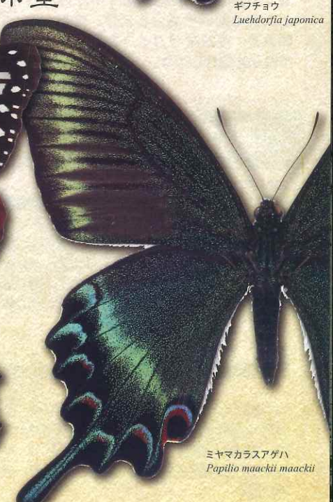
ミヤマカラスアゲハ Papilio maackii maackii