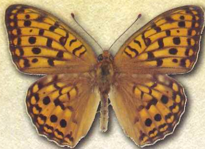
オオウラギンヒョウモン Fabriciana nerippe nerippe