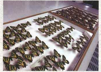
布藤コレクション