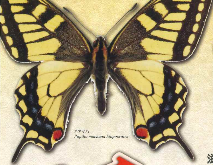
キアゲハ Papilio machaon hippocrates