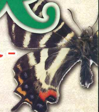
ギフチョウ Luehdorfia japonica