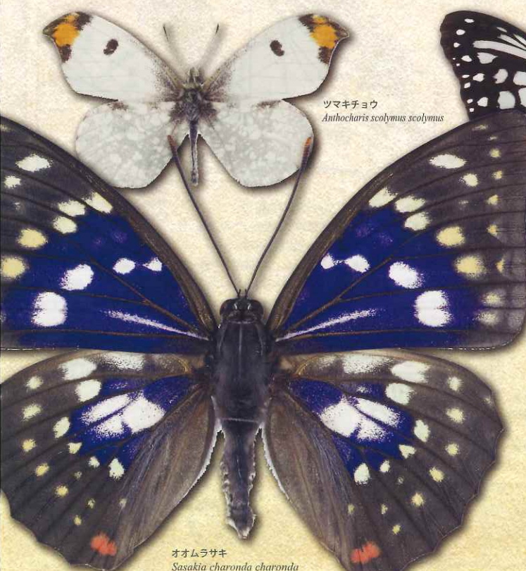
オオムラサキ Sasakia charonda charonda