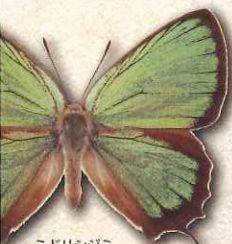
ミドリシジミ Neozephyrus japonicus japonicus