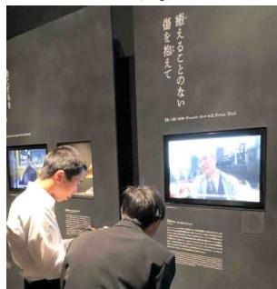
▲2年 国際平和ミュージアムでの学習