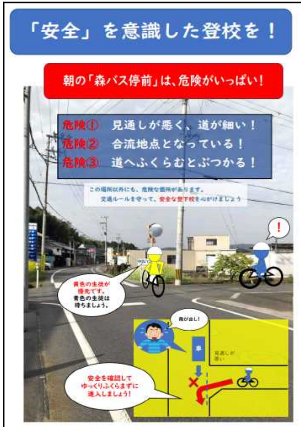
▲教室や昇降口に示した啓発ポスター

この時期から、雨の降る日が多くなることが予想されることから、自転車通学生が9割を占める本校では、「通学の安全」が大きな課題のひとつです。