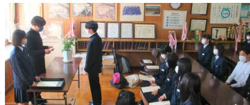
▲生徒会長から任命