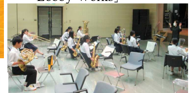
▲演奏前のリハーサルのような多彩な曲調を豊かに表現できました。

小編成の部 南部地区大会 金賞 県大会 銀賞 演奏曲 「Lobby Works」