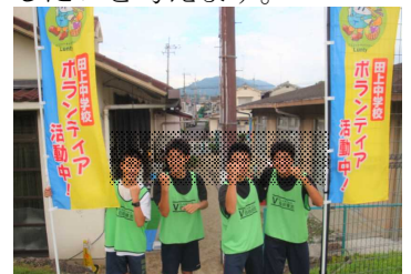
▲8/4 田上児童館での「ひまわりサマーランド」の運営スタッフとして4名が協力

夏休み中に、すすんでボランティア活動に参加したみなさん、おつかれさまでした! 小さな「つむじ風」が確かに起こっています!