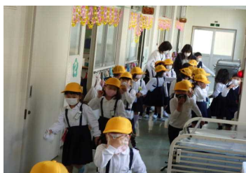
↑【煙を吸わないように…】

写真にもあるように低学年にもかかわらず、しっかりとマスクの上からハンカチを口に当てて訓練をしている子どもも見られました。