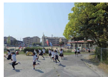
↑【外に出たら走ります】