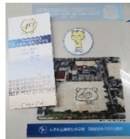
配布された冊子とクリアファイル