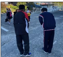
<あいさつでお出迎え>

11/13(月)~11/17(金)の期間、瀬田北中学校2年生が学校での仕事を体験するために、職場体験学習にやってきました。