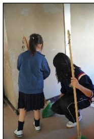
<もくもくそじのよきお手本に>