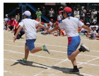
<6年生:見事なバトンパス>

保護者の方から「学年ごとにバトンパスがうまくなっていく様子を見ることができ、感心しました。」というお声をいただきました。また、低学年の「まっすぐに全力で走る」ことや「上手な身のこなしで走っている」姿に子どもたちの成長を感じた保護者の方もおられたことと思います。