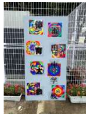
(特支学級作成の看板)

何よりも生徒たちの躍動する姿には日頃の学校生活では見られない一面が見て取れました。そして、熱心に競技する人も、クラスや団に向けて応援する人もみんなが一つになって取り組んでいる姿は、大きな感動を与えてくれました。