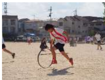
(タクティクスリレー)