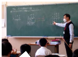
3けた×3けたの筆算をしました。【4年生】