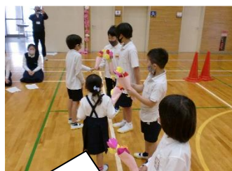
「青空歓迎会」では、全員でゲームを楽しみました。【青空】