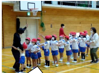
集合と整列の仕方を学びました。【1年生】