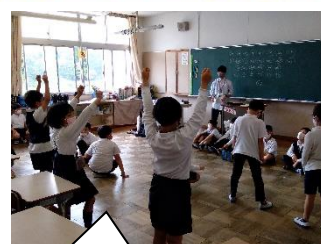
「1年生を迎える会」の練習をしました。【3年生】