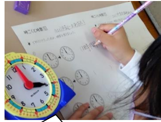
「時こくと時間」を学習しました。【2年生】