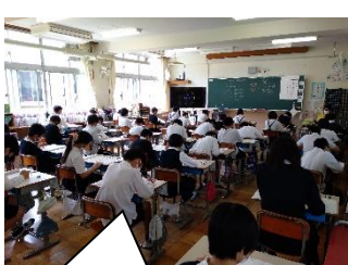
「全国学力・学習状況調査」がありました。【6年生】