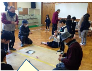
地域の方に、昔遊びを教してもらいました。【1年】