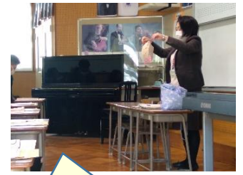
入学説明会& 体験入学 (1/30)