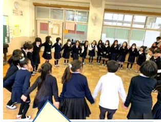
「なべなべそこぬけ」を楽しみました。【2年】