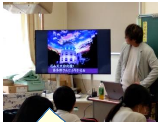
ゲストを招きキャリア学習を進めています。【6年】