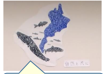
歴史博物館に展示された共同制作作品です。【青空】