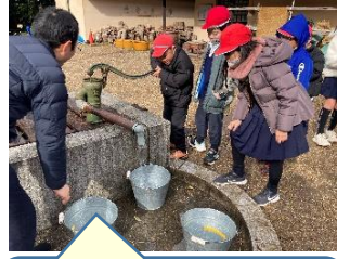
琵琶湖博物館で昔の生活体験をしました。【3年】