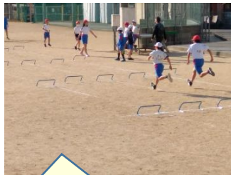
ハードルをリズムよく走り超えるのが目標です。【5年】