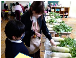
【青空】だいこん屋さん