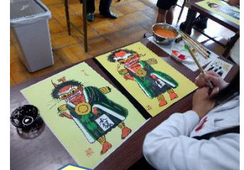
大津絵作家出前授業【5年】