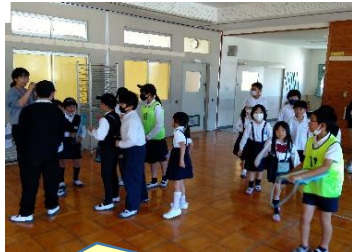
なぞときスターイベント