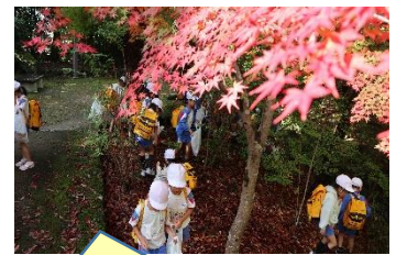
文化ゾーンで秋みつけ【1年】