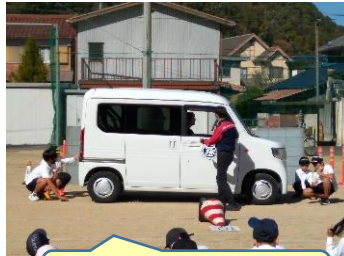
J A F 交通安全教室