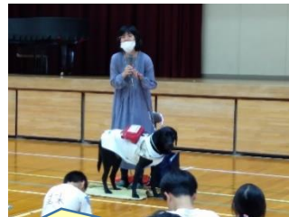
盲導犬ユーザー出前授業【4年】