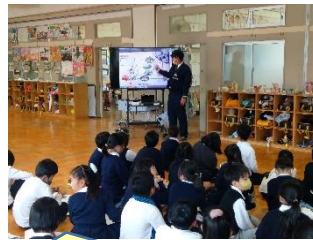
警察官出前授業【3年】