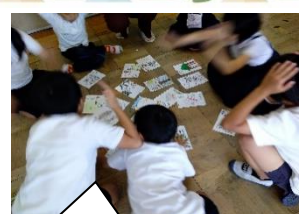
大石カルタを作って遊びました【3年生】