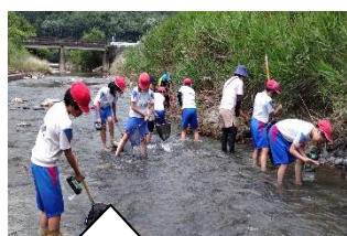
大石川で、水生生物の調査をしました【5年生】