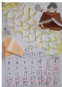
七月のカレンダーを作り、各教室に配りました【青空】