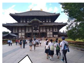
奈良で校外学習をしました（写真は東大寺）【6年生】