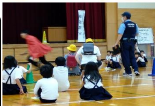
地域の方、警察官、市内子ども安全リーダー、学校の先生たちによる、防犯教室を開催しました【1・2年生】