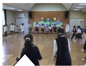
大石幼稚園を訪れ、5・5交流をしました【5年生】