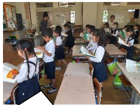
全員で詩を音読しています【1年生】