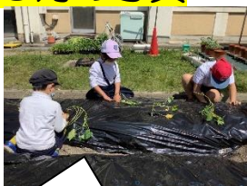
畑にサツマイモの苗を植えました【青空】