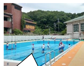
プール清掃をしました【6年生】