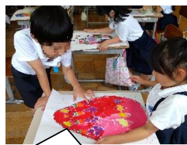
「ふしぎですてきなカラフルたまご」をつくりました【2年生】