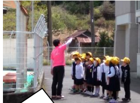
学校の施設を案内してもらいました。【1年生】