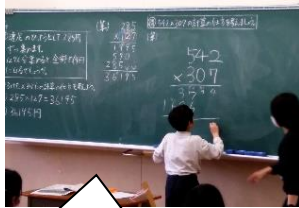
3桁×3桁の筆算をしています。【4年生】