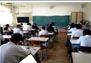
「全国学力・学習状況調査」がありました。【6年生】