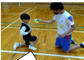
「青空歓迎会」では、ゲームを楽しみました。【青空】