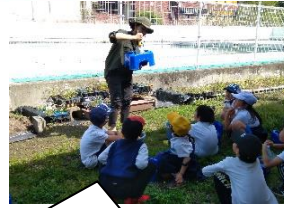
咲き終えたチューリップの鉢の中を観察しました。【2年生】