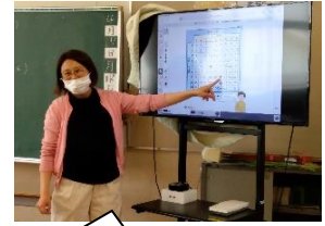
かける数と積の関係を調べました。【3年生】