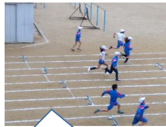
リズムよくミニハードルの上を走ります【3年】