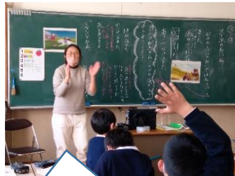
「スーホの白い馬」を読み進めました【2年】