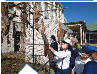
ヘチマの種を収穫しました【4年】