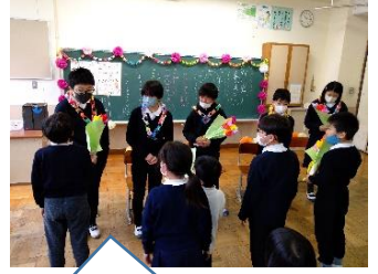
青空お別れ会をしました【青空】