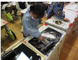
スチレン版画「海の生き物」をしました【1年】