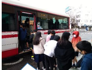
バスの乗車マナーを教えられました【6年】