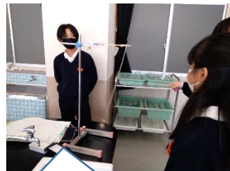
ふりこの1往復にかかる時間を調べています【5年】