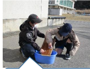
社会科で、昔の洗濯に挑戦しました。【3年】