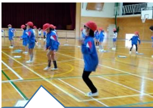
なわとびの色々な技を練習しています。【1年】