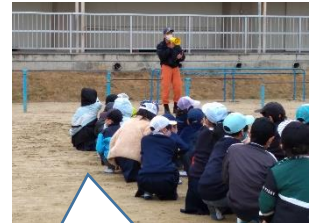
1/17 避難訓練 (地震～火事)