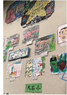
作品展鑑賞のため、歴史博物館へ行きました。【青空】