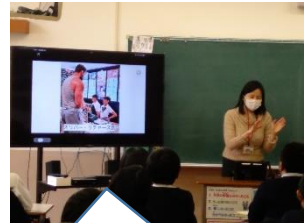
ゲストを招き、夢や職業のお話を聞きました。【6年】