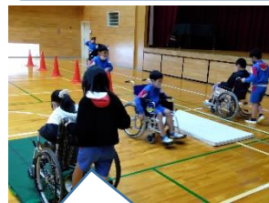
車椅子に乗ったり、押したりを体験しました。【5年】