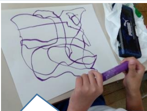
線と線の重なりから、版画の構図を考えました。【4年】