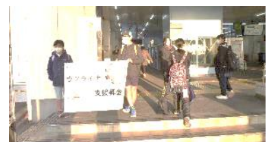
日吉子どもサミット募金活動 ウクライナ支援の募金を駅前前で呼びかけました。募金は国際交流協会を通じ支援活動にあてられます。