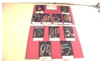
たんぱぽ合同作品展 歴史博物館に市内各校の作品が展示されました。本校はネームプレートと蠟書（ロウで書いた書）を出品しました。