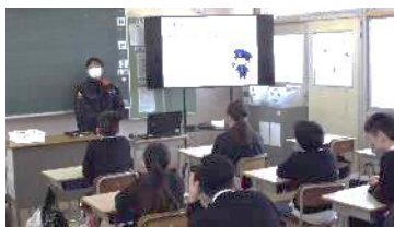
6年警察によるいじめ防止教室 いじめが犯罪につながることやどうすれば防げるかなどを考えました。お話を真剣に聴く姿が印象的でした。