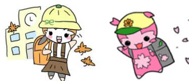
あきっぴー & さくっぴー