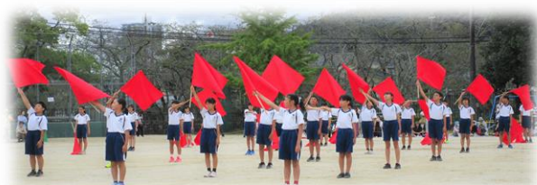
6年生 集団演技 フラッグ ベストパフォーマンス ～魅せる 一人ひとりの心の成長～