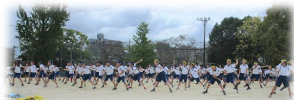
5年生 集団演技 ソーラン節 最高の演舞を創り出せ！ ONE TEAM！ソーラン！

運動会を通して、子どもたちは「全力で取り組むこと」や「仲間と協力して行事を創りあげること」などを体験することができました。学級や学年としての高まり、個々に実感できた自信をこれからの学校生活に活かしてほしいと願っています。一人ひとりの子どもたちにとっても、学級や学年、さらに学校全体にとっても、より一層実り多き2学期にしていきたいと思えます。