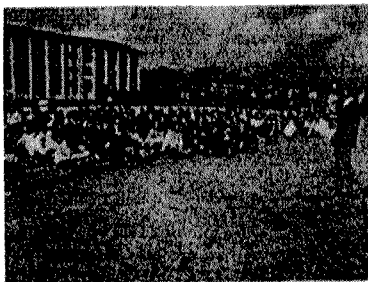
1月10日(火) 避難訓練実施(地震)